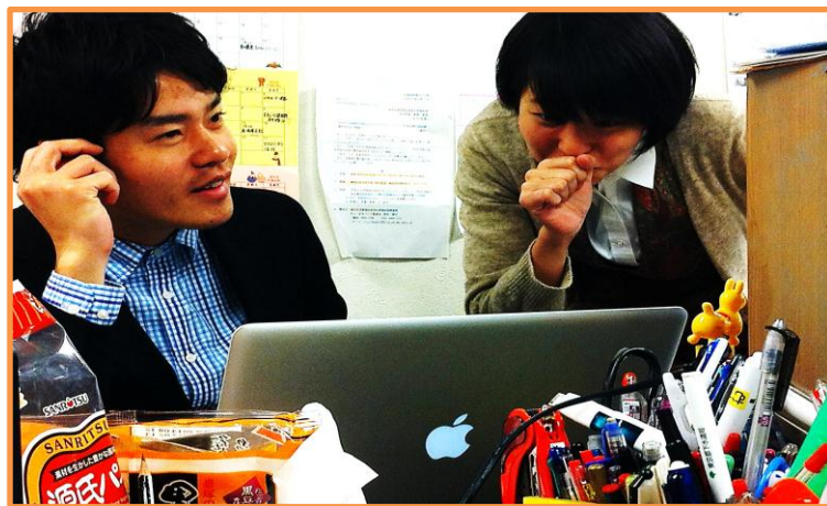
むすびの業務を手伝ってくれます。視点が新鮮です。

建築専攻の学生さんが作るポスターはさすが、デザインがカッコいいです。これは！？というチラシを見かけたら学生製作です。